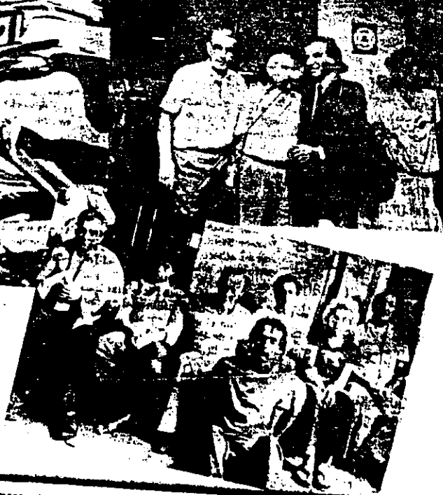
Figuran también informes sobre las actividades en la Argentina. Los archivos pueden esclarecer el destino de los paraguayos desaparecidos.